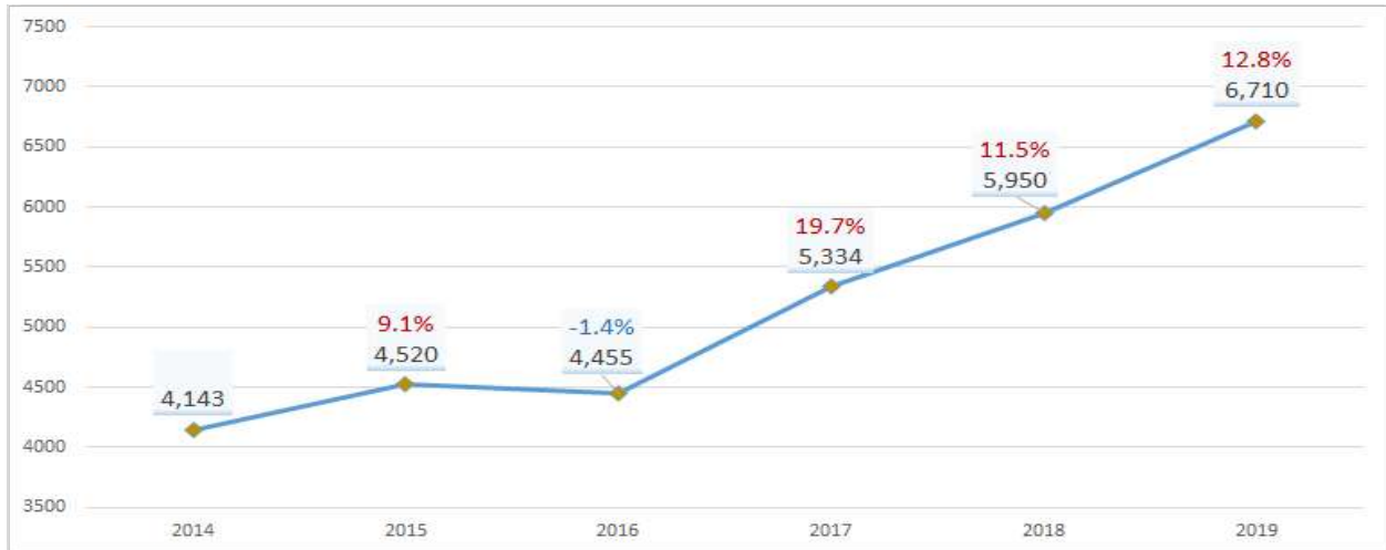
< 개인 위생관련 상표 연도별 출원 동향 >