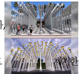
위: 미국 LA, 아래: 인도네시아

① 해당 조형물이 인도네시아 지식재산청에 저작권 미등록 상태임에도 불구하고 ② 저작권은 저작물의 창작과 동시에 발생하고 보호된다고, 피고에게 69,000불 상당의 배상금 지불, 인도네시아어 및 영자 일간지에 공개 사과, 판결일로부터 30일내 침해 조형물 철거를 명령('21.6.14)