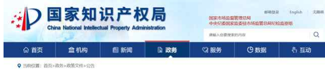
关于调整商标注册证发放方式的公告 (第453号)