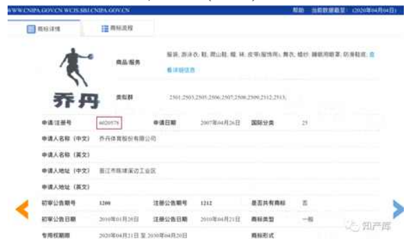
《중국에 등록된 마이클 조던 관련 상표》

* '07년도에 출원되어 미국 나이키 회사보다 먼저 등록되었으며, 상표(우측)는 조단의 동작 도안과 조단의 중국어 이름으로 구성