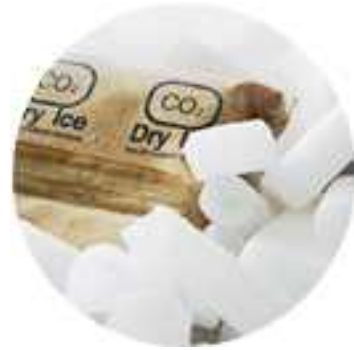
< 드라이 아이스 - 고체 이산화탄소 >