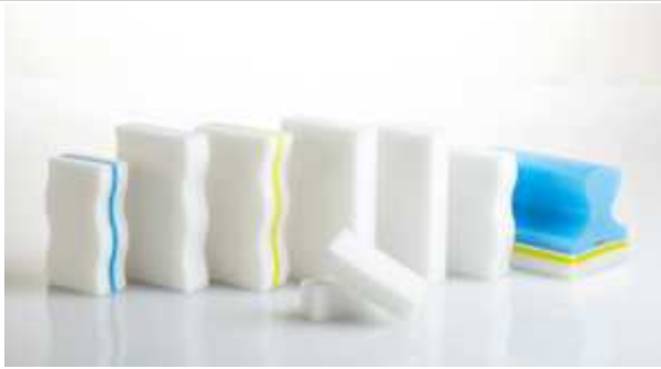
< 매직블럭 - 세척용 스펀지 >