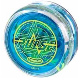
< 요요 - 줄을 풀어 돌리는 장난감 >