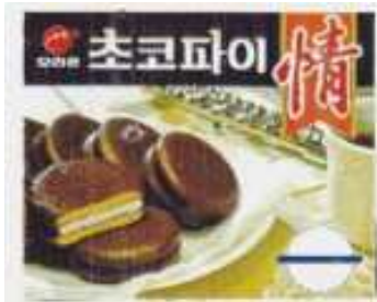
< 초코파이 - 오리온초코파이 >