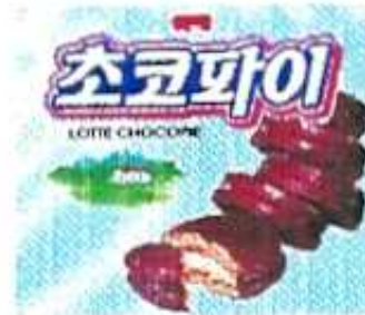
< 초코파이 - 롯데초코파이 >