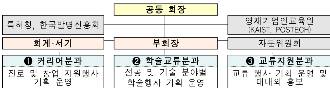
< 차세대영재기업인 네트워크 조직 및 활동 구성 >

* 공동 회장, 부회장 등 운영진 및 분과별 운영인력 모두 교육원 수료생으로 구성